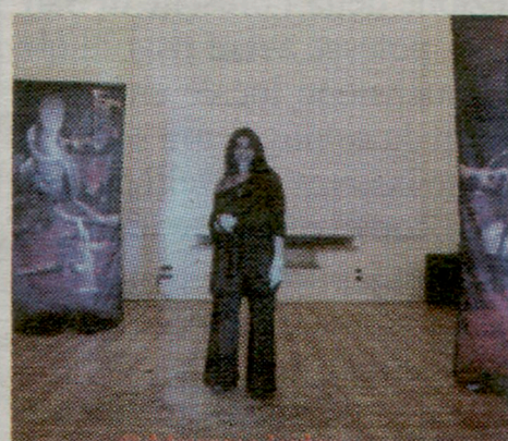
A sinistra una delle opere proposte, sopra l'artista